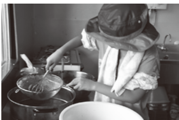
美味しいジャムができあがりました

8月8日に「つくば味工房」で、ブラックベリージャムづくりをしました。手がベリベリ色になるくらいたくさん摘んで、ジャムづくりを行いました。甘いジャムの香り、とっても美味しそうです。