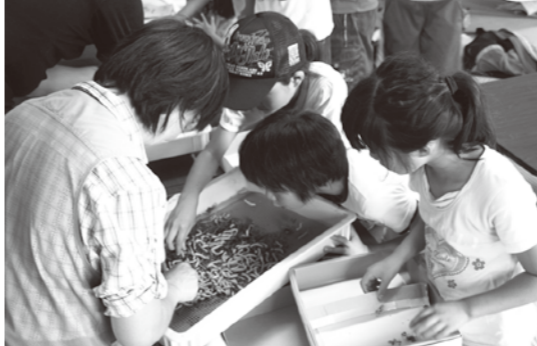
蚕に興味津々の子どもたち

かつて養蚕を営んでいた農家の方々に、昔の話をうかがいました。養蚕が盛んな時期は、筑波山から土浦まで蚕の餌となる桑畑が続いていたそうです。年に1回しか採れないお米に対して、蚕は繭が最大6回もでき、そのたびに現金収入があつて助かったそうです。家族総出で働き、繭を1トンつくって表彰された