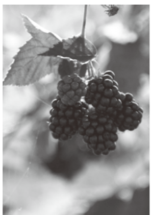
つくば味工房で穫れたブラックベリー