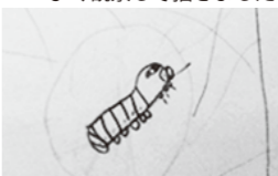
よく観察して描きました

こともあるとか。1個約20グラムの繭、いったい何個だったのでしょうか。当時は、蚕影神社も参拝者で賑わったそうです。その後、子どもたちに蚕を配布しました。桑の葉をたくさん食べて繭になる不思議な蚕に子どもたちは夢中でした。育て方について先生や元養蚕農家の方に教わって、蚕の里親となり、後日、繭と観察日記を提出しました。観察日記にはイラストと蚕の様子がいっぱいと記されていました。