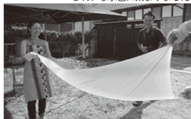
きれいな水色に染まりました

8月26日に「藍の生葉染め」が行われました。藍の葉を摘み、染料をつくり、布をキレイに染めあげました！染料につけ空気に晒すと鮮やかな水色に変化。参加者からは歓声があがりました。