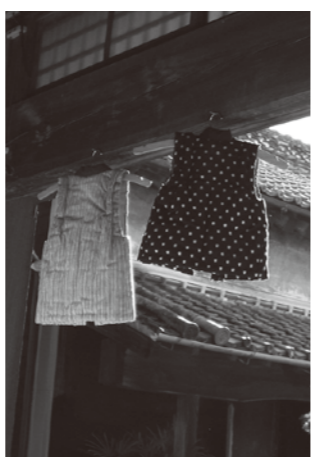
縁側に揺れるたはんでん