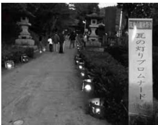
秋の夕べに幻想的な灯りが似合います