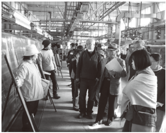
広い繰糸場内でガイドから説明をうけました

◆富岡製糸場の正門ゲートから入ると、正面に東繭倉庫。木造を想像していたが、意外にも木骨のレンガ造りで、その大きさに圧倒される。つづいて、検査人館、女工館、ブリュナ館、繰糸場を見学。いづれも明治初期の建築で西洋風の瀟洒な建物が、広い敷地内にバランスよく配置されている。