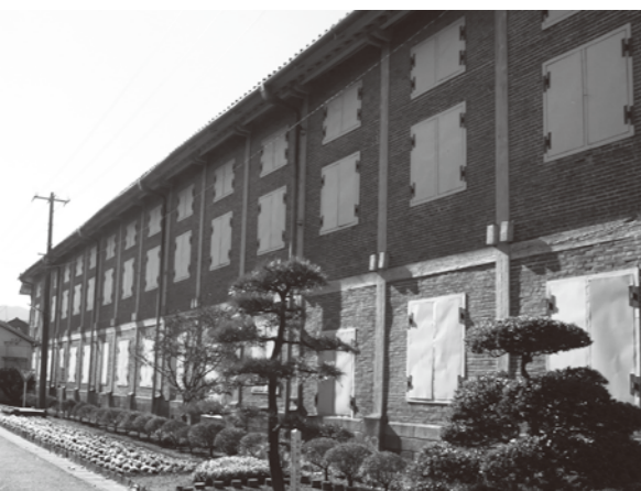
レンガの壁が美しい富岡製糸場

官営の製糸場として明治5年に建設され、日本の製糸業を牽引した富岡製糸場は、115年間稼動した後その役割を終え、現在では歴史遺産として大切に保存されており、世界遺産登録を目指し活動中です。筑波山麓も同様に養蚕が盛んだったので、世界遺産登録を目指す…というわけでは無いのですが、富岡市が富岡製糸場を中心に地域の生活文化を保存