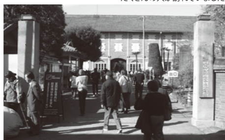
たくさんの方が訪れていました

【主な行程】富岡製糸場↓甘楽郡小幡町NPO自然塾寺子屋と交流↓富岡市NPO田舎暮らし支援ネット視察