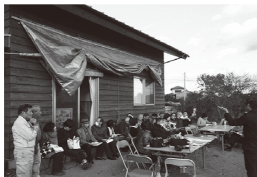
地元のNPOの方にお話を伺いました