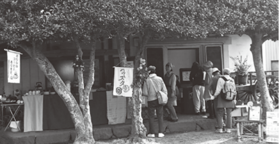
鮭川邸の蔵の前で店開き

やカプチーノなどもメニューに加えたところ、びっくりするほど多くの人に喜ばれました。またお昼には、無農薬で育てた「筑波山すそみ米」で炊いたご飯に、色とりどりのおかずを添えた弁当もす