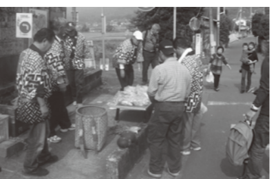
獲れたて野菜も好評でした