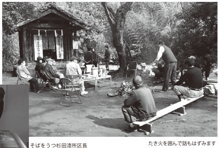
たき火を囲んで話もはずみです