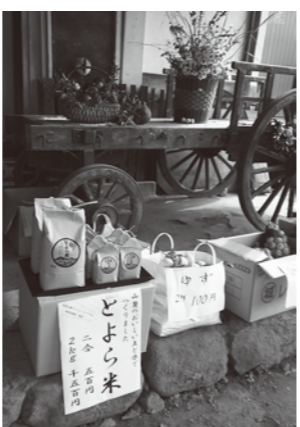
とよら米やゆずもならびました