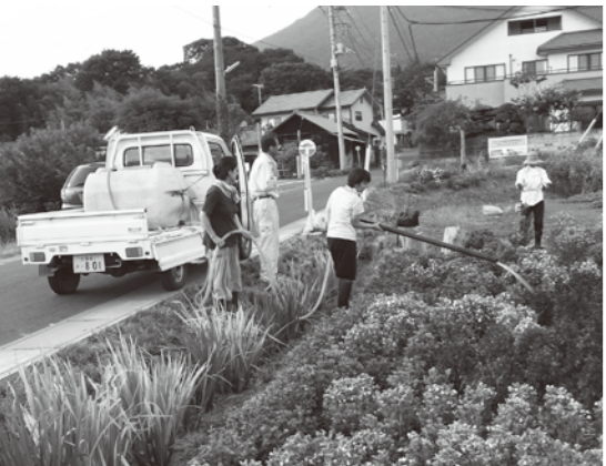
水まきも大変。でも花はつくば道を往来する人の気持ちを豊かにしてくれます。

ベゴニアの白い文字が周囲の赤いベゴニアの間から浮き立つように美しく咲いて、つくば道を歩く人を楽しませたのは、7月末頃まで。その後8月は雨が降らず、ずっと猛暑が読いたので、畑の土は干ばつでカラカラになり、カンナくずを全体に敷きつめましたが効果はあまりなし。水まきは、3日に一度の割合で、500リットルのタンクで4回、た