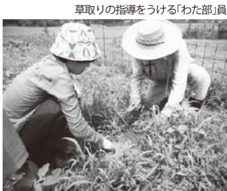
草取りの指導をうける「わた部」員

「もう裁縫をやらなくなったけど、こないだ片付けしたら、綿を入れるばかりのはんてんが出てきたよ。