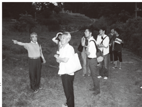
イノシシの被害についてお話を伺いました