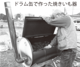
ドラム缶で作った焼きいも器

竹林整備で出た竹を利用して作る「竹ベンチ」「竹トンボ」「竹ぼっくり」。すそみならではの材料を生かした催しです。穴あけ、ひも結び、かなづち使いなど現代の人達が是非習得してほしい技です。親子で助け