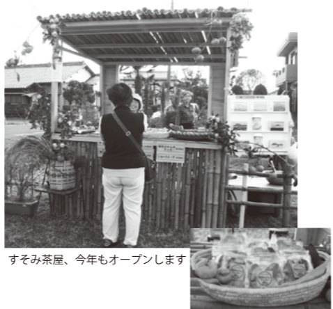
すそみ茶屋、今年もオープンします

昭和33年の嫁入りの時に、のら着やふとんを持っていくために、ご実家では綿畑を1枚増やしたとのこと。のら着の帯は、縦糸を綿糸、横糸をぼろきりで織ったそうです。