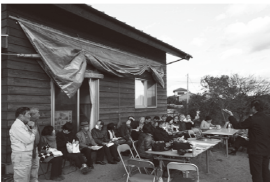
地元のNPOの方にお話を伺いました

での活動を通じ、 地域活性化を目 指す「自然塾寺 子屋」と交流。 地元農家や近隣 の大学と立ち上 げた地域ブラン ド「純愛」につ いてうかがいま した。地元のコ だわり農産物や 加工品をおしや れなパッケージにまとめ魅力的にブ ランド化し販売しています。農産物 はお米、しいたけ、下仁田ねぎ。加 工品は味噌、ジャム、ドレッシング、 こんにやくなど。筑波山麓でも、今 年は山麓のおいしいお米に着目し、 「豊浦(とよら)米」と名付けました。 美味しいものに目がない協議会の面々 なので、純愛ブランドに負けないよ う筑波山麓の魅力発信していきた いと思えます。