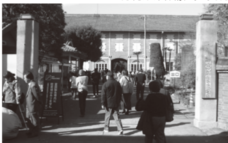
たくさんの人が訪れていました

しているように、蚕影神社を中心として、桑畑、炭焼き、藍染など里山の風景や生活文化を保存し、体験型の観光へつなげたいと考えています。富岡市では富岡製糸場課をつくり活動していますが、やはり課題は、まちづくりや周辺住人の協力とのことでした。それならば、古代の絹伝来の地といわれる筑波が協力したい！と果敢にアプローチしました。製糸工場、女工の宿舍などを見学し、文明開化の頃の日本を垣間見た視察でした。