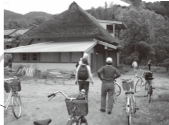
茅葺き民家をちよつと拝見