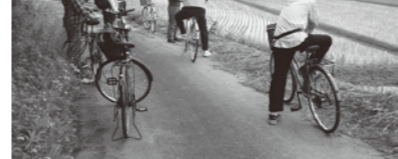
ここから眺める筑波山は絶景！みんなてしばしたずむ