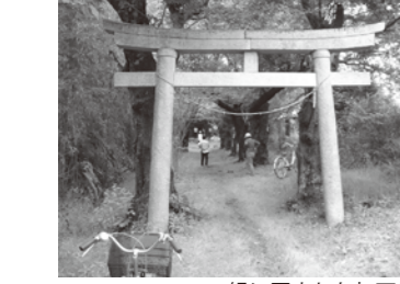
緑に囲まれた初西神社

サイクリングで感じたこと ●休憩所があったらいいな ●案内板がほしいな ●電動自転車があったらいいな