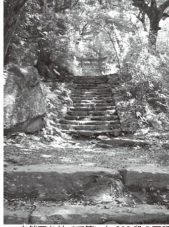
自然石を並べて築いた200段の石段