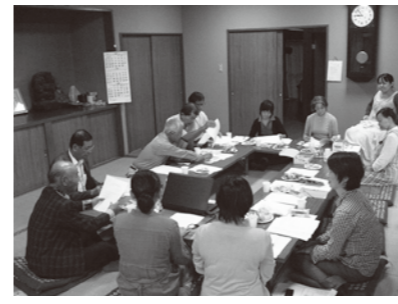
「筑波山麓グリーン・ツーリズム協議会」の検討会議。これからさまざまな活動をしていきます。

☆「つくば道に花を植えてお客さんの心を癒す」は10/23~11/6まで連日開催されています