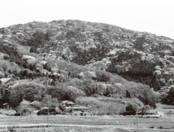
山桜咲く神郡の山々

ヤマザクラは普通の桜よりも寿命が長い巨木になるらしい。神郡山の山桜は切らなかつたので、大きくなつたのだという。かつては、山があつた松に替わり、山桜が主人となつているのだろうか。同じ場所に育つヤマザクラでも一週間程度の開花時期のずれがあるため、ソメイヨシノとは違って、短期間に花見をす